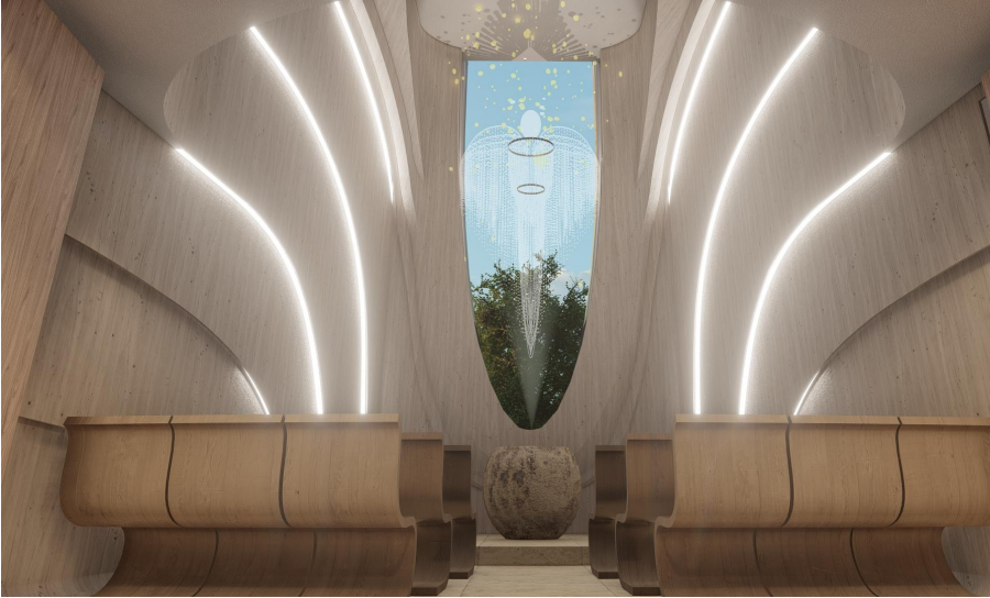
vizualizace materiálového a prostorového uspořádání místnosti ticha

POZN. - rozkreselní stěnových panelů viz D.1.1.5.03 - zadní strana svislých panlů budou LED pásky viz Kniha svítidel - maximální výška stropu je 7,9 m - zhotovitel zajistí lešení - zhotovitel nese odpovědnost za tvarovou stabilitu a konstrukční pevnost - nedílnou součástí zadání je vizualizace prostoru